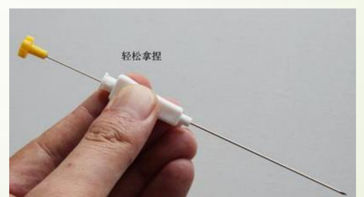
图3 一次性微创埋线针